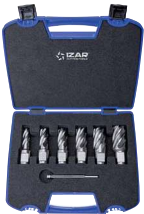
Set 6 Pcs