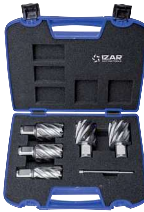
Set 5 Pcs